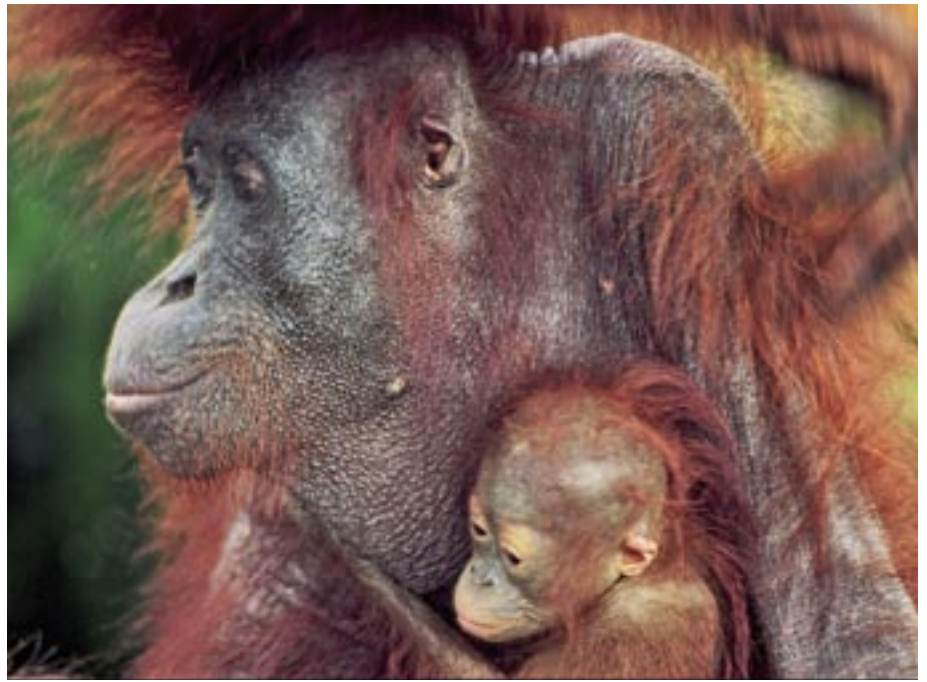
1.000 Orang Utan haben allein dieses Jahr durch Brandrodung ihren Lebensraum verloren

Wir stellen Ihnen in diesem Regenwald Report einige unserer Projekte vor, die wir alphabetisch gekennzeichnet haben. Diese Kennzeichnung wiederholt sich auf der Rückseite im Spenden-Coupon. Sie können durch einfaches Ankreuzen ganz gezielt wählen für welches unserer Projekte Sie spenden möchten.