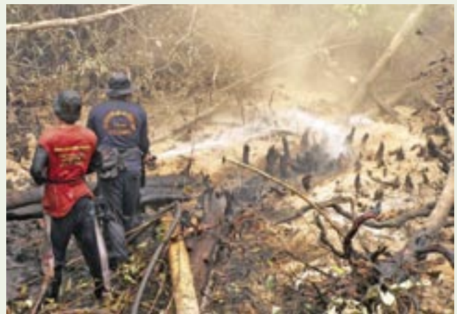
Qualmender Torfuntergrund vor abgeholztem Regenwald