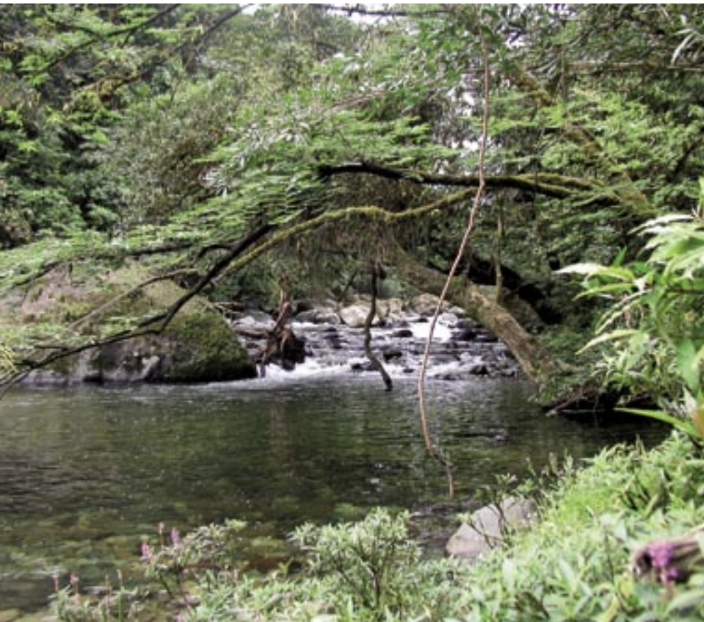
Tululbí-Fluss im Regenwaldgrundstück angrenzend an das Awa-Territorium bei La Unión, Provinz Esmeraldas, Ecuador