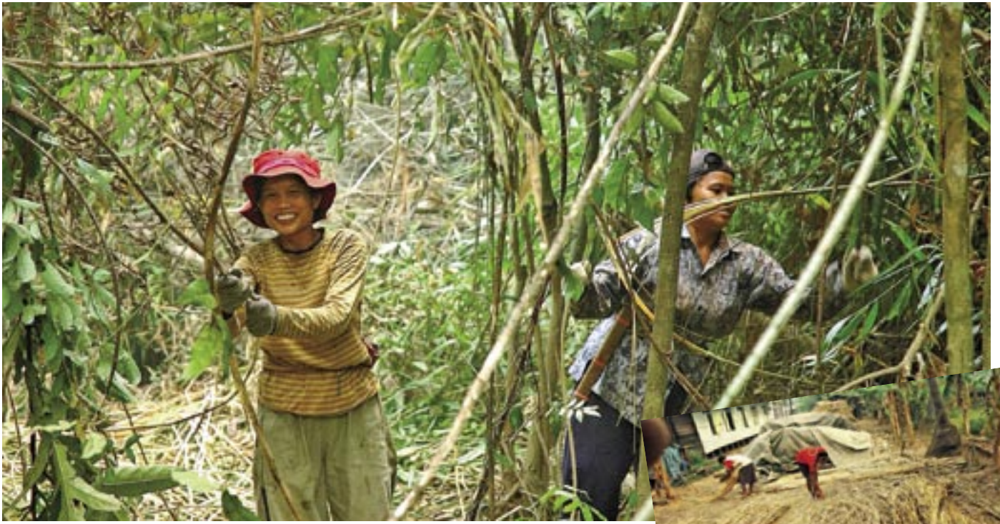
Frauen bei der Rattanernte und Bauern legen den Rattan zum Trocknen aus