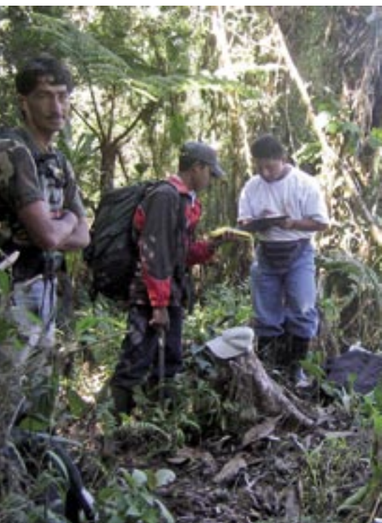
Vermessung des Sperrgrundstücks im Bergregenwald von Junin durch den Techniker der Federation Awa