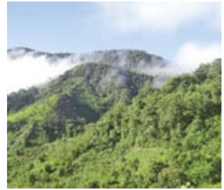
Lebendige Natur: 115.000 Hektar Regenwald durch die Awa Indianer geschützt. In der Region Choco sind 20 Prozent der Pflanzen- und Tierarten endemisch