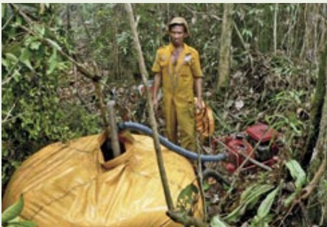
Das Löschwasser wird in diesen Behältern bereitgestellt

flächen zur Speicherung der Feuchtigkeit zur Verfügung stehen. Leider wird sogar in Naturschutzzonen mit Feuer gerodet, wie im Tanjung Puting Nationalpark oder in Nord-Sulawesi am Tangkoko Nationalpark gesehen. Hier schaffen sich die ärmsten der Bauern neuen Raum für ihre Zuckerpalmen – unter den Augen von Naturschützern und Rangern. Naturschutzprojekte haben manchmal ihre eigenen Eingreiftrupps, damit die Arbeit von Jahren nicht einfach in Flammen aufgeht, wie schon so oft geschehen. In Ostkalimantan kann man vom Wachturm des Wiederaufforstungsprojekts Samboja Lestari jeden Abend an anderer Stelle neue Feuer auflodern sehen. Das Projekt der Friends of the National Parks (FNPF) im Tanjung Puting Nationalpark ist nicht so gut ausgestattet, gerade sind wieder tausende frisch gepflanzter Setzlinge dem Feuer zum Opfer gefallen.