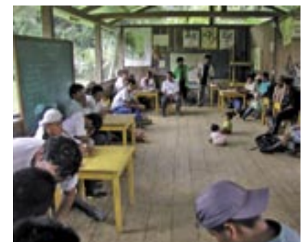
Dorfversammlung der Awá-Indianer im Regenwald in Esmeraldas, Ecuador