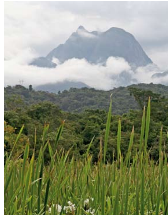
Die Heimat von 1,6 Millionen Tierarten muss gegen Spekulanten geschützt werden

angeeignet. Manche dieser Besitze sind Tausende von Quadratkilometern groß. Weite Teile der Flächen dienen der Landspekulation. Sie werden nicht genutzt und liegen brach.