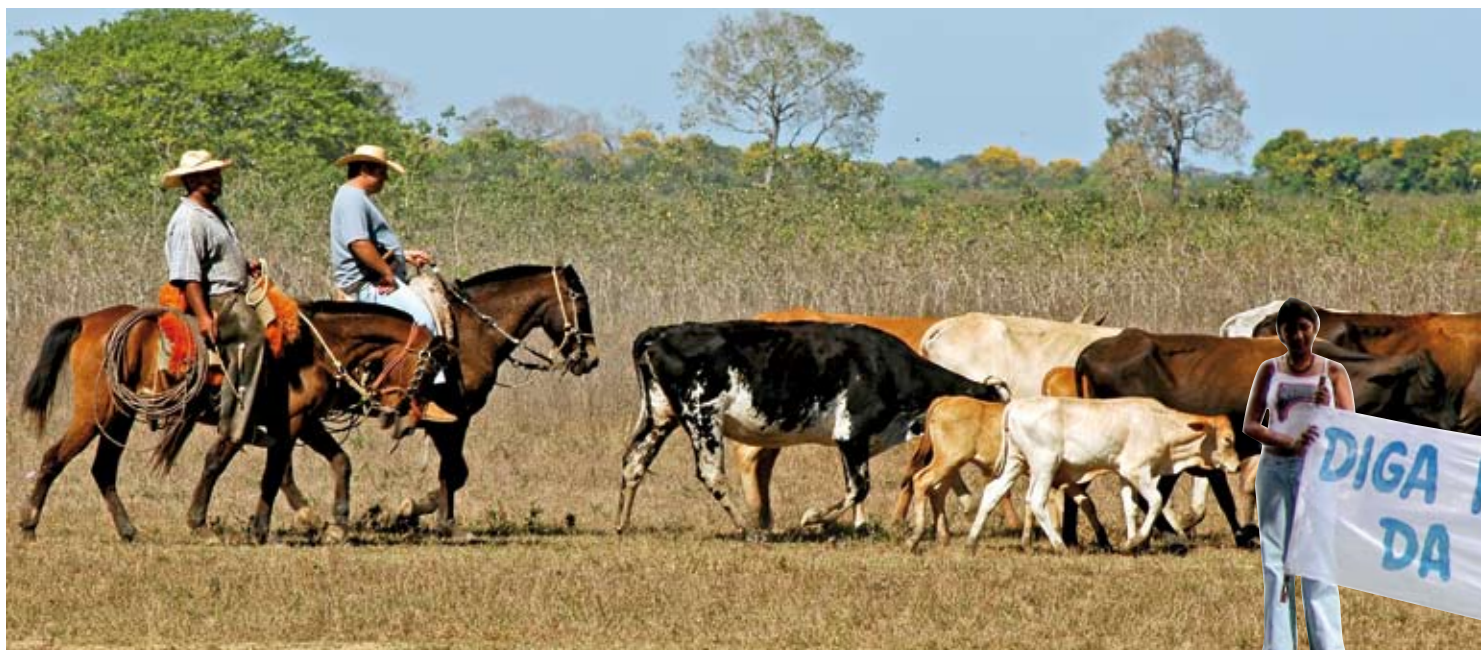
Brasilianische Umweltgruppen protestieren gegen die Brandrodung für schädliche Rinderzucht