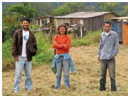
MST-Aktivisten sorgen für eine gerechte Aufteilung der Agrarflächen

Der größte Teil der landwirtschaftlichen Flächen und viele Waldgebiete in Brasilien befinden sich in den Händen einer kleinen Elite von Großgrundbesitzern. Die meisten von ihnen haben sich die Flächen illegal und unter Ausnutzung der krassen sozialen Ungleichheit